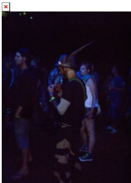
Naoko zanimljiv čovjek

Naokolo floorova bilo je podignuto nebrojeno mnogo šatora isprepletenih s razim šankovima što su nudili palačinke, vegetarijansku hranu i meso, energetska pića od bazge i guarane, kavu... Osim ugostiteljskih štandova, bilo je tu i nekoliko štandova s neobičnim nakitom i odjećom. Na moje čuđenje, ovogodišnji Future Nature bio je vrlo dobro posjećen - vjerojatno s razlogom jer su se organizatori - Audiovizualna udruga Marsova soba - zbilja potrudili. Publika je bila multinacionalna, a opet međusobno visoko tolerantna jer nisam zamijetio nijedan incident, što je čitav događaj učinilo još i boljim. U paketu s multinacionalnim dolazi i šarenilo boja kože i odjeće koju su svi ti ljudi nosili te jezika koje su govorili. Svi oni plesali su zajedno kao pravo pleme, slaveći svoje i tuđe postojanje - slaveći život - svakidašnji povod za slavlje jer raj je sada i ovdje!