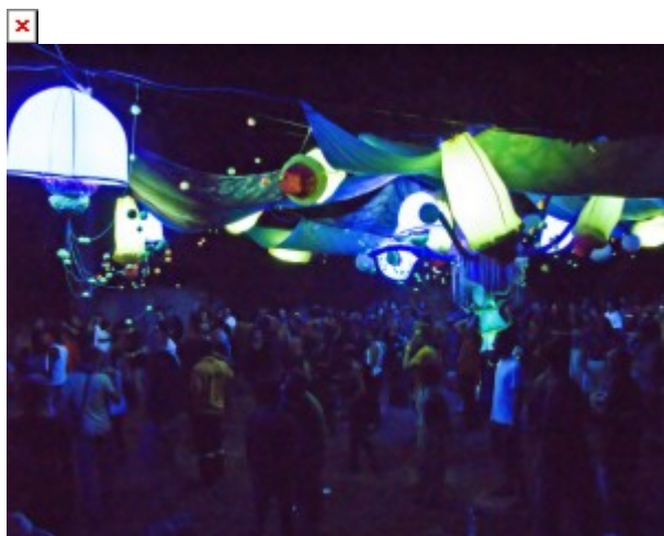
Atmosfera na main flooru

Ovogodišnji Future Nature započeo je u četvrtak 12. kolovoza. Nakon što sam, po prvi put, uspio dogovoriti prijevoz preko Facebook-a, baš toga četvrtka zaputio sam se iz Opatije prema Rovinju. Put je trajao nevjerojatnih šest sati, ali putovao sam u dobrom društvu pa nije bilo jako naporno. U Rovinju me dočekala jedna draga osoba koju nisam vidio gotovo godinu dana. S njom sam se, nažalost, družio samo jednu noć jer sam već u petak kasno navečer, sa troje frendova, otišao u Pulu da posjetim možda najveći trance festival u Hrvatskoj - Future Nature . Ubrzo nakon odlaska iz Rovinja moje noge su odskakivale u nabrijanom ritmu i psihodelično nabrušenim melodijama prenoseći dobre vibracije na cijelo tijelo.