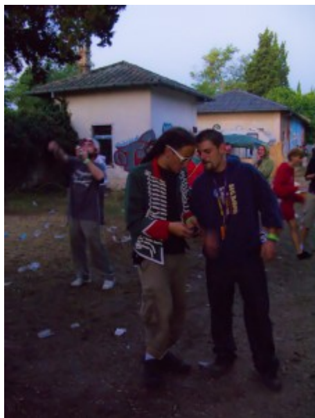
...i još jedan