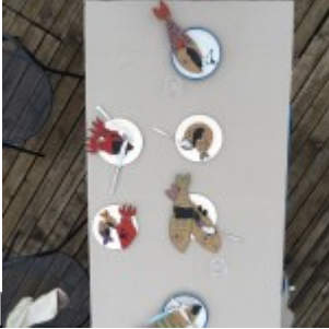
papaline na crno