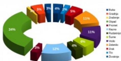
Grafikon 4, Udio prijava po kategorijama i udrugama u prvom polugodištu 2015.