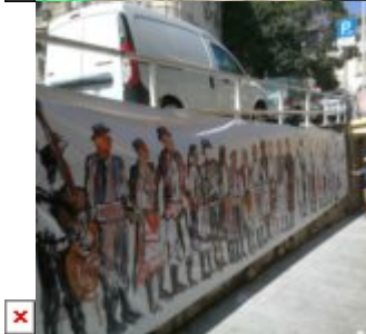
Međunarodni dan mladih u Opatiji - slike