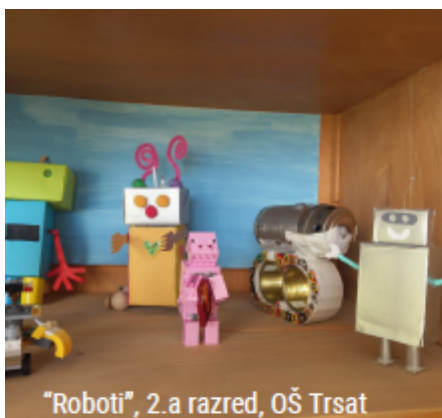
"Roboti", 2.a razred, OŠ Trsat