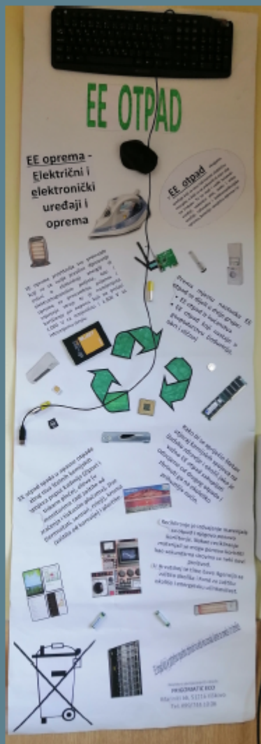
"EE otpad", Noah Ogrizović, 5. a, OŠ Fran Franković

Natječaj je organizirala Udruga Žmergo u suradnji s Gradom Rijekom kroz EU projekt "Izobrazno-informativne aktivnosti o održivom gospodarenju otpadom - natjecanje u školama u izradi kreativnih stvari od prethodno prikupljenog otpada", kao jednu od niza aktivnosti kojom se nastojalo poticati maštu i kreativnost, razvoj vještina te osvještavanje djece o važnosti odgovornog postupanja prema okolišu i potrebi brige za zajednicu kroz smanjenje otpada.