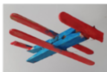
"Avion" OŠ Zamet