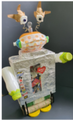
"Moj eko robot" OŠ Srdoči