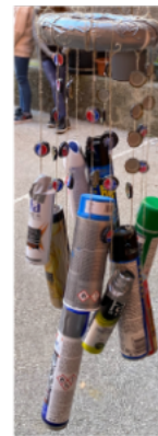
"Vjetar zvonu" OŠ Centar