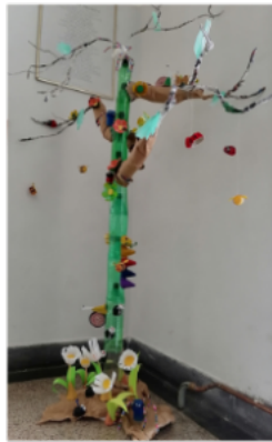
"Drvo 10 svjetova - dva života" OŠ Brod Moravice