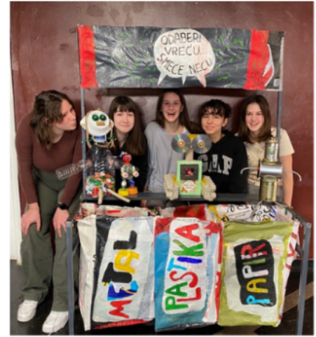
K4. "Odaberi vreću, smeće neću" OŠ Vežica

Ove godine, zbog iznimno jake konkurencije imamo i nekoliko posebnih priznanja i to za: