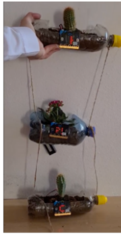
K3. "Pametni važi" OŠ Kostrena