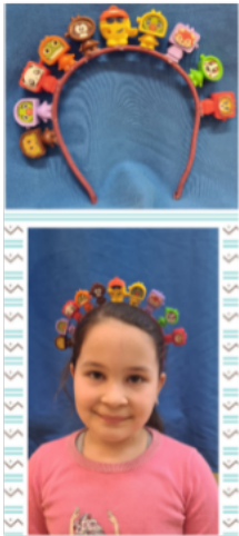
K1. "Rajf od igračkaka" OŠ Nikola Tesla