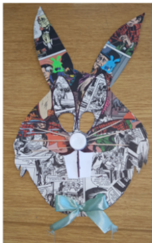
K2. "Kreativna maska" OŠ Hreljin