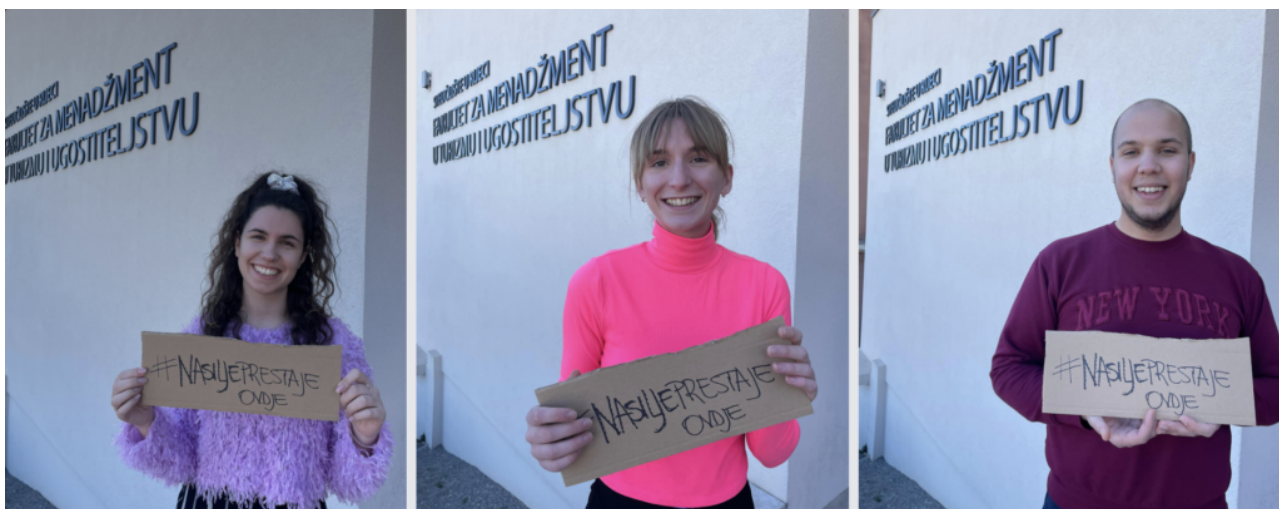
Iz prošlogodišnje galerije opatijskih ambasadora vršnjačkog nasilja